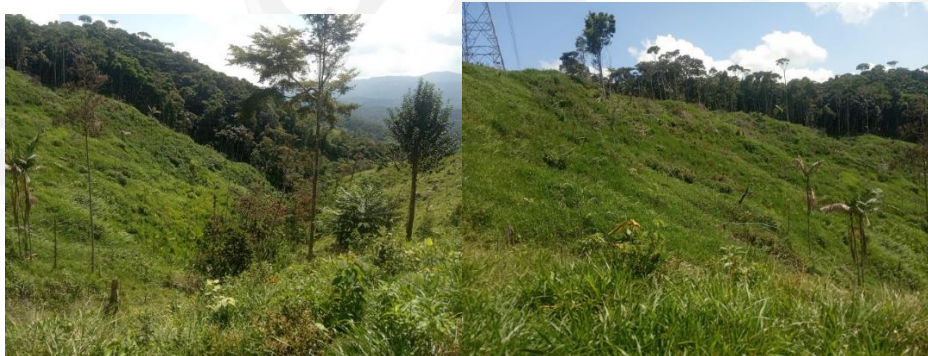
Estado actual del área donde se realizó el aprovechamiento forestal.