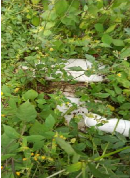
Foto 1. Pozo séptico unifamiliar.