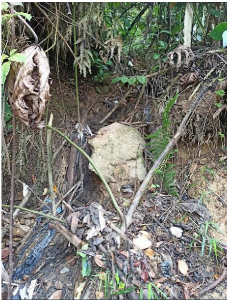
Foto 3. Residuos sólidos represados.