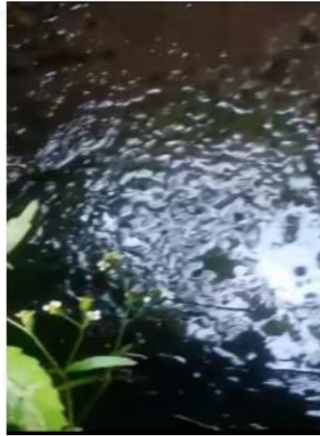
Foto 4. Represamiento aguas mieles.