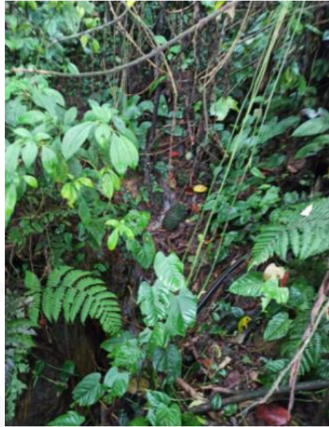
Foto 2. Nacimiento de Agua.