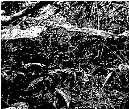
FOTO 1: Área de protección de nacimiento de agua FOTO 2: Obra de captación FOTO 3: Desarenador