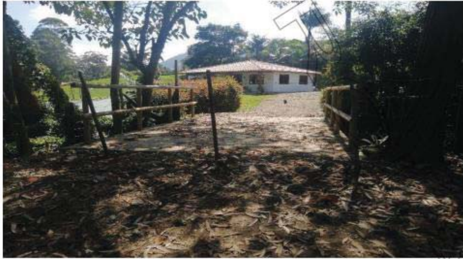
Imagen No 1 puente construido