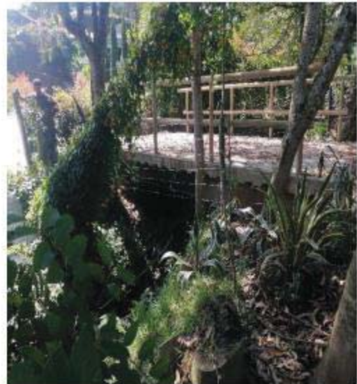
Imagen No 2. Trinchos en tierra y costales y cerramiento en alambre de púas a ambos costados