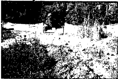
Anexo fotográfico 1.