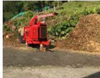
Chipiado de residuos

A continuación, se presenta registro fotográfico de la actividad.