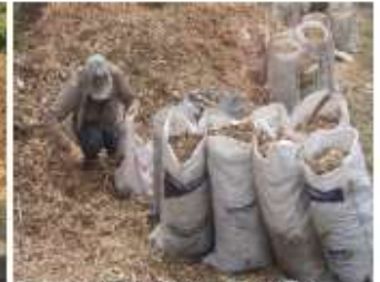
Empaque de chipiado obtenido