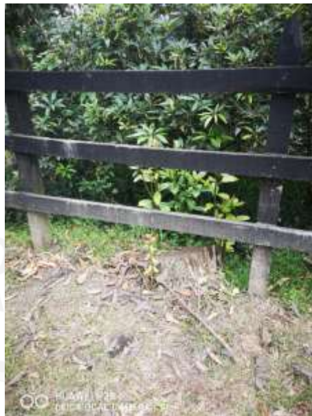
Imagen 6. Tocones de individuos aprovechados.

Verificación de cumplimiento de Requerimientos o Compromisos: Actividades a cumplir de acuerdo con la Resolución de autorización 131-1004-2019 de 12 septiembre de 2019.