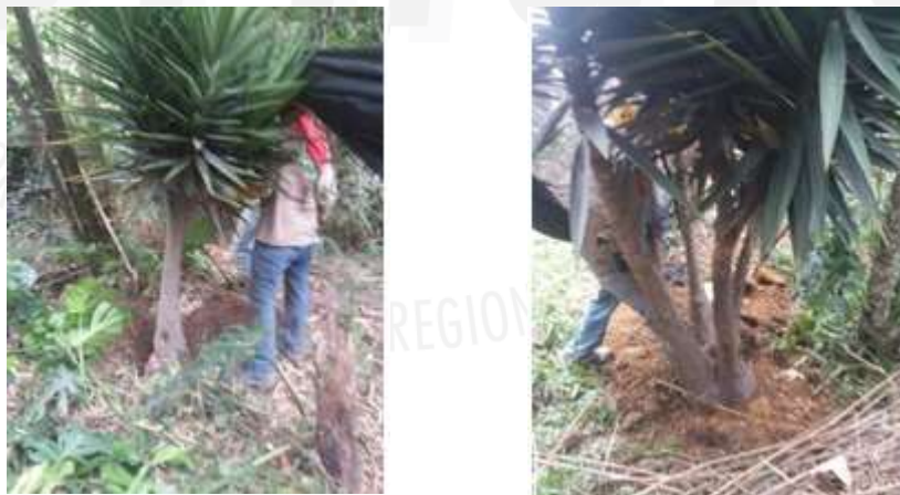
Imagen 5. Zona donde se ubicaban las Palma Yucas ( Yucca guatemalensis Baker), que fueron trasplantadas. Fuente Informe de actividades presentado en el interesado Radicado No CE-02969-2021 de 22 de febrero de 2021.