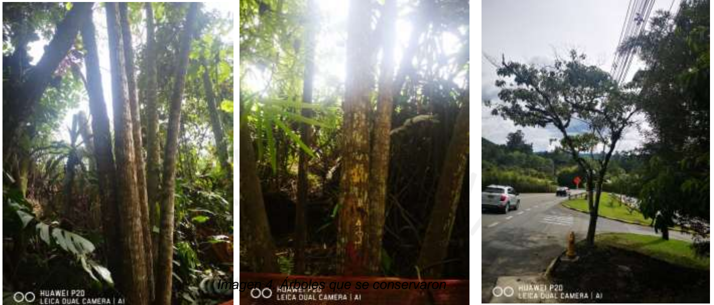
Imagen 4. Árboles que se conservaron