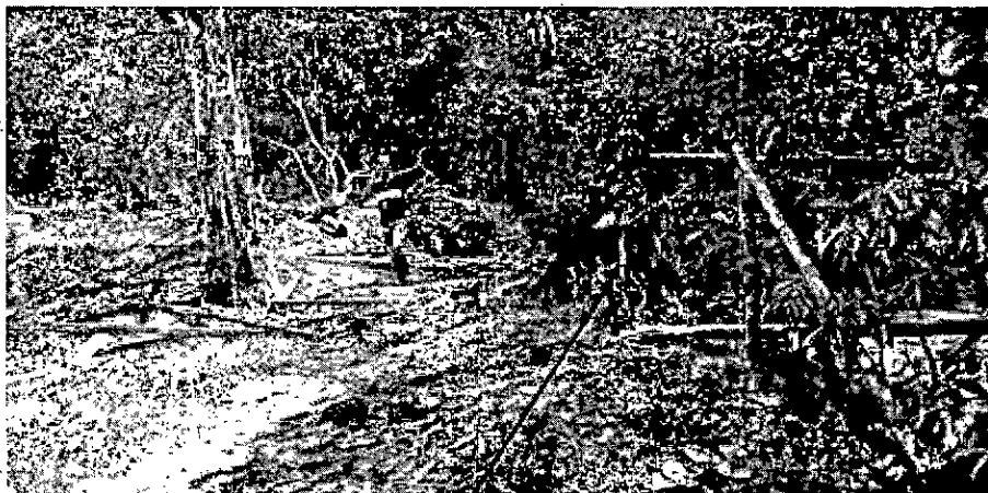
Árbol de cedro aislado sobre margen izquierda de una fuente de agua