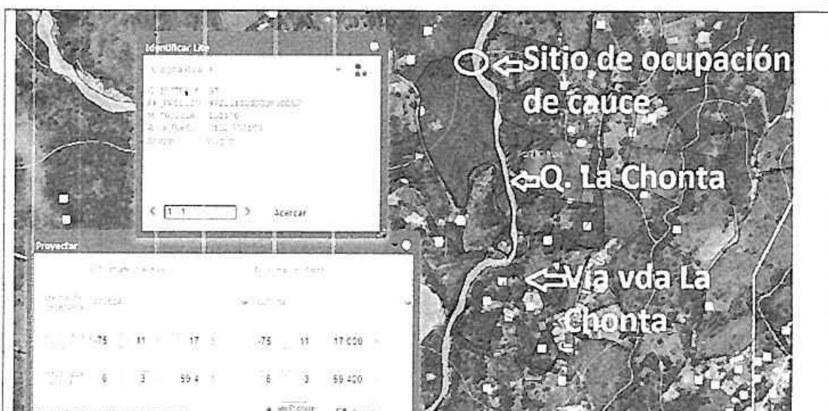
Ortofoto 1. Ubicación del predio objeto de la queja y sitio de ocupación de cauce.