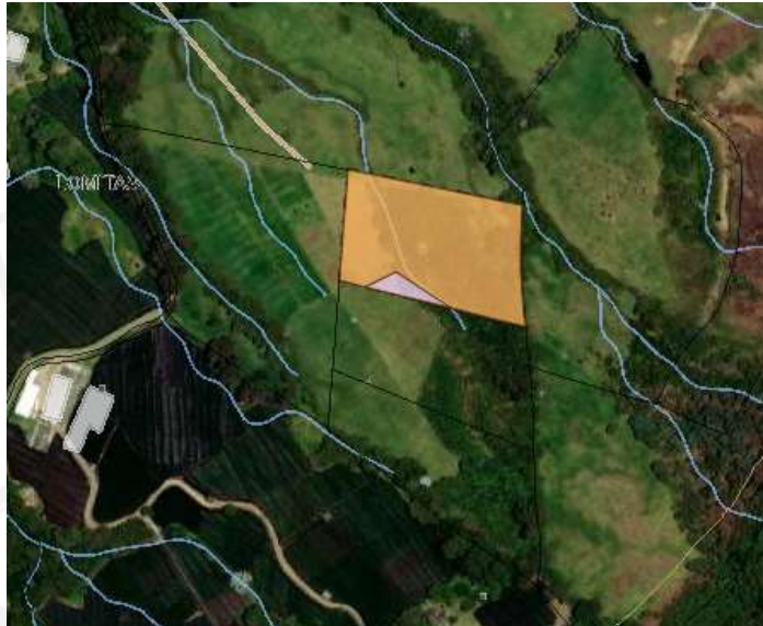
Imagen 2: Zonificación ambiental Predio FMI 017-46189