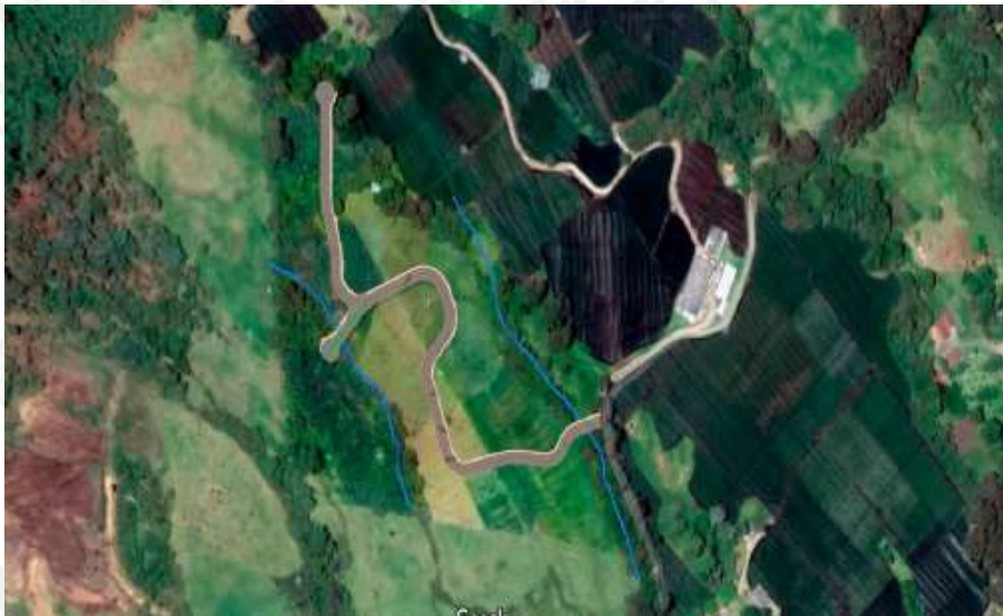
Imagen 1: Visualización del proyecto y fuentes hídricas.

Al interior del predio discurre dos fuentes hídricas (Imagen 1) las cuales de acuerdo al plan de manejo entregado será respetada las rondas hídricas considerando el Acuerdo 251 de 2011, el proyecto se enfocará en la recuperación de la continuidad boscosa del cuerpo de agua, mejorando sus las condiciones ambientales.