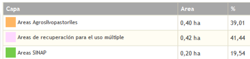
Imagen 5: Zonificación ambiental Predio FMI 017-46192

De conformidad con la Resolución No. 112-4795 del 8 de noviembre del 2018 "Por medio de la cual se establece el régimen de usos al interior de la zonificación ambiental del Plan de ordenación y Manejo de la Cuenca Hidrográfica del Río Negro en la jurisdicción de CORNARE", los árboles objeto de la solicitud se encuentran en áreas: