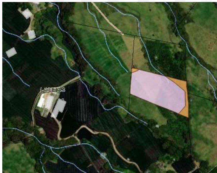
Imagen 3: Zonificación ambiental Predio FMI 017-46190