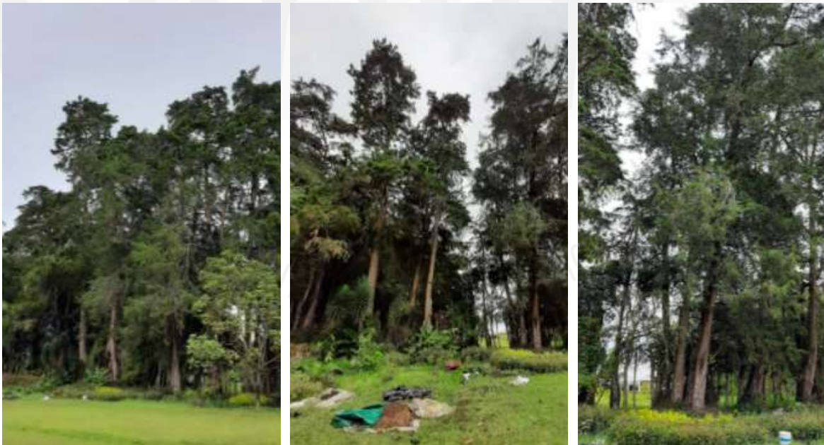
Imágenes 4, 5 y 6: Ubicación y estado de los árboles que componen el cerco vivo.

Los árboles no están asociados a fuentes hídricas y no hacen parte de las listas rojas de especies amenazadas.