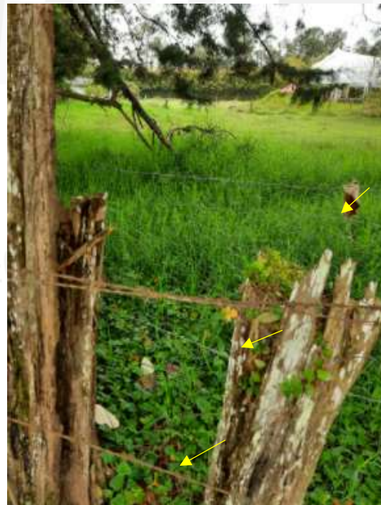
Imágenes 2 y 3: Composición y ubicación de los cercos perimetrales, tres líneas de alambre.