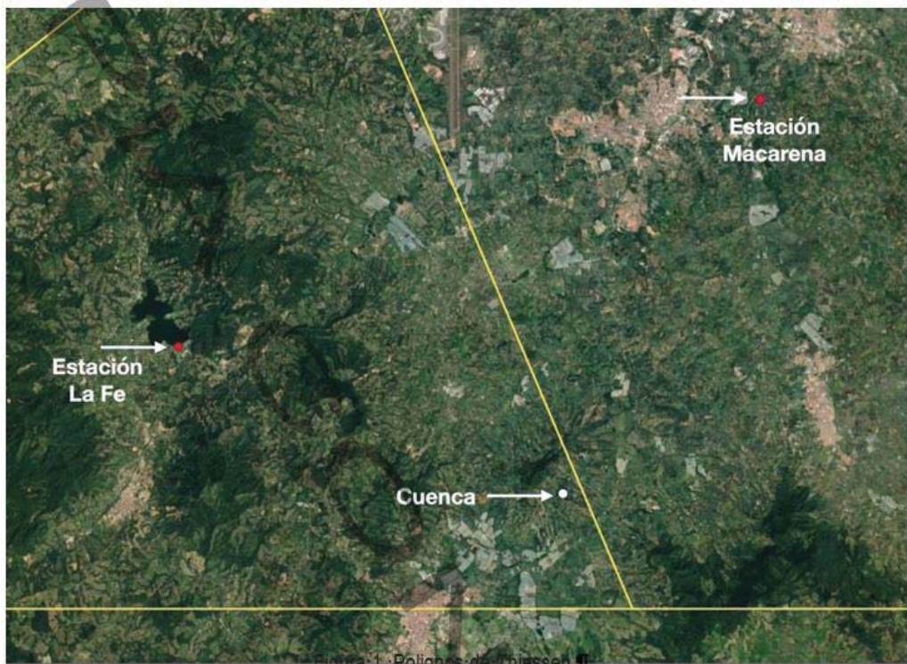
Figura 1. Polígonos de Thiessen

El siguiente cambio realizado en el nuevo informe es la de la inclusión de nuevos métodos de cálculo de caudales entre ellos el índice de crecientes y la metodología GRADEX, para los cuales no se incluyen las memorias de cálculo, ni se especifican los datos usados.