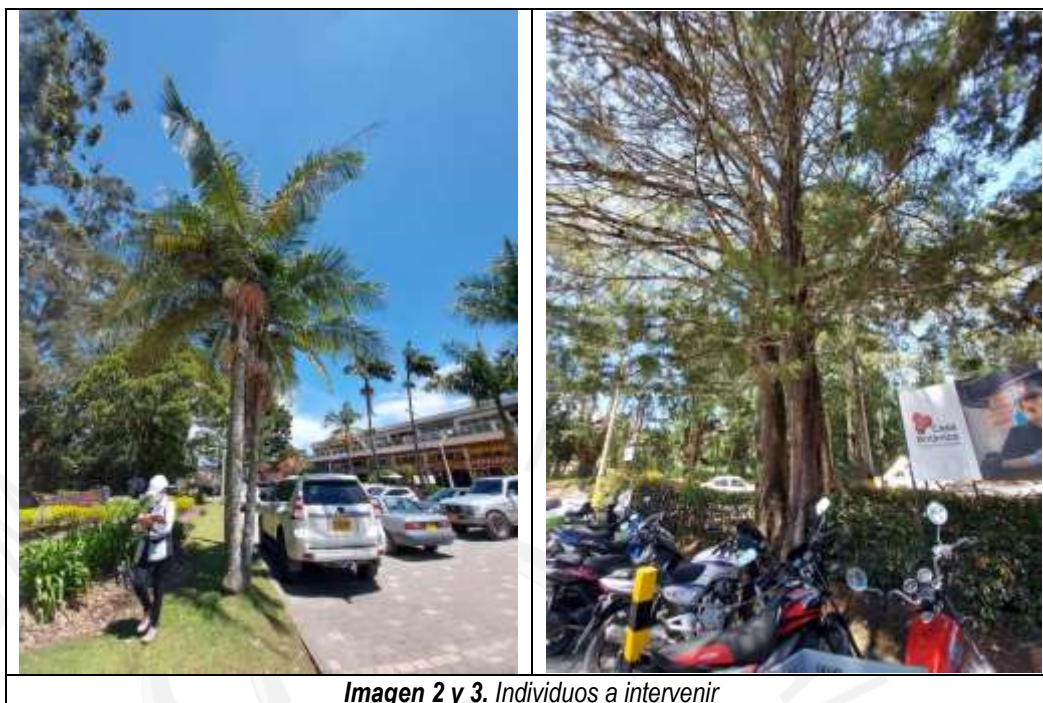
Imagen 2 y 3. Individuos a intervenir