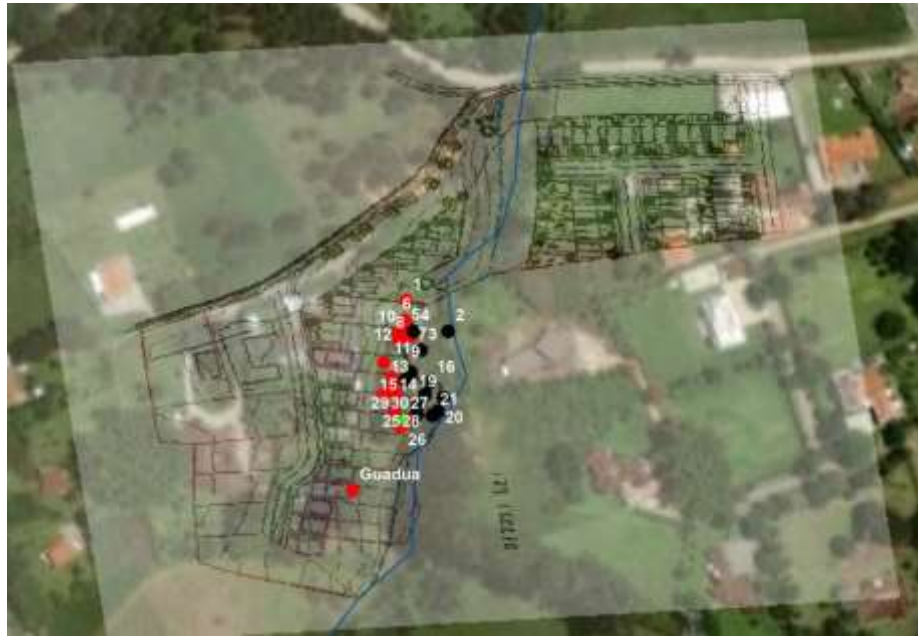
Imagen 1. Diseño proyecto y arboles solicitados en rojo