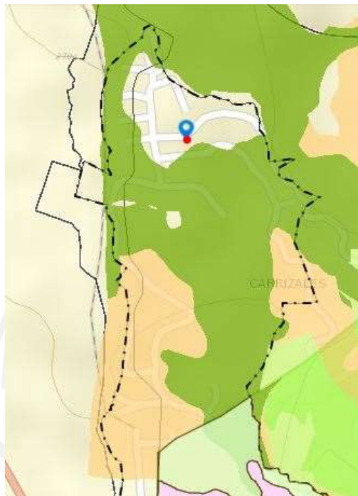
Imagen 2. Ubicación predio en relación a

Ya que el lote de interés no se encuentra regido bajo alguna determinante ambiental asociada a un POMCA o algún Acuerdo Corporativo, las actividades permitidas en esta área estarán definidas por lo que establezca el POT del municipio.