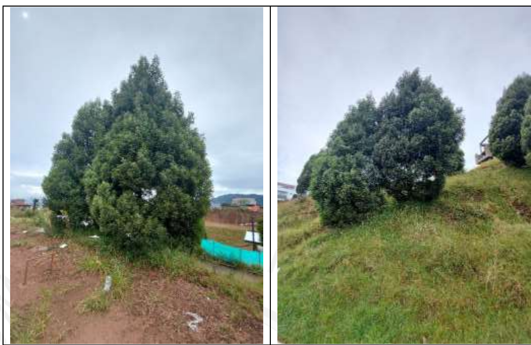
Imagen 3 y 4. Individuos en predio