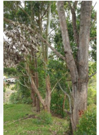
Imágenes 6, 7 y 8: Cercos vivos internos y externos, conformación y estado de los árboles.