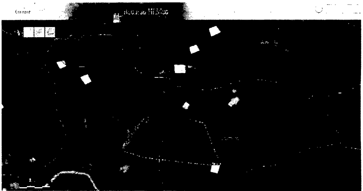
Imagen 1. Predios implicados y delimitación del humedal.

El predio con PK 5412001000001800041, propiedad del señor Ismael Zúñiga Arce, interesado en esta queja, se ubica en la parte más baja del terreno con relación al otro predio, (parte superior en la ortofoto), en este se realizaron una serie de drenajes para canalizar el agua del nacimiento y conducirla hasta la Quebrada el Victorial, que discurre por el predio del señor Ismael Zúñiga. Esta obra fue realizada con el objetivo de secar un poco el terreno y mantener las guaduas que tiene sembradas, manifiesta el señor Zúñiga.