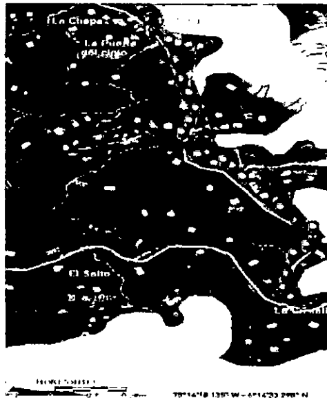
Localización predio La Puerta del Cielo vereda La Chapa, el