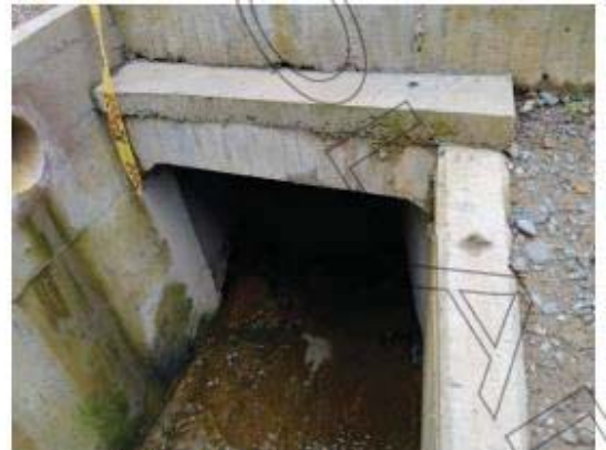
Salida Box Couvert