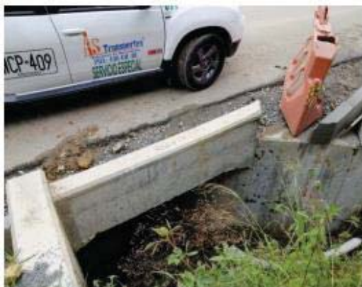
Entrada Box Couvert