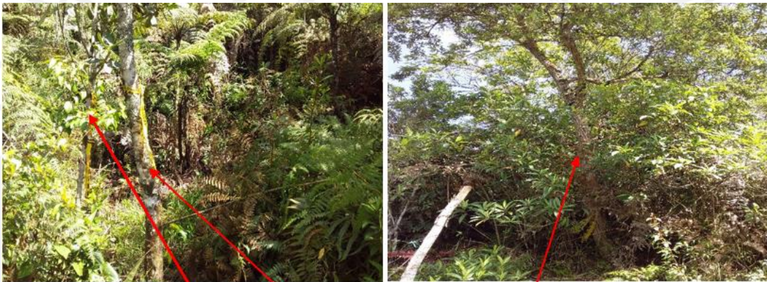
Registro fotográfico de árboles para aprovechar