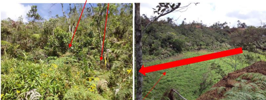
Trayecto por donde se construirá la vía y las explanaciones.