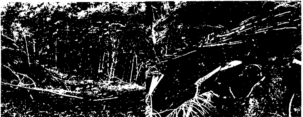
Tala y quema de bosque natural