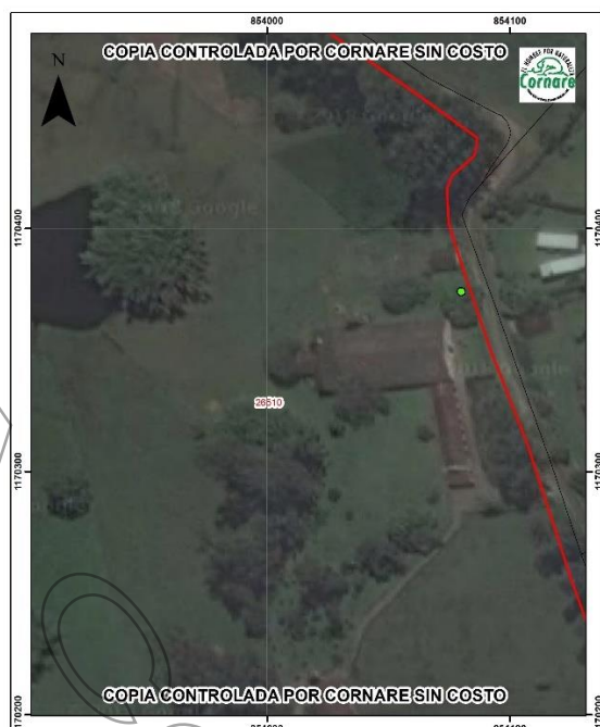
Imagen 2: Ubicación del rodal en el predio.

De acuerdo con la información aportada por los interesados, donde se allega la descripción del rodal de Guadua, y, según lo observado, la solicitud se presenta para el aprovechamiento mediante tala rasa (tipo I) del rodal con las siguientes características: