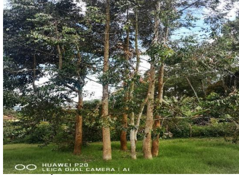
Imagen 2. Árboles objeto del aprovechamiento