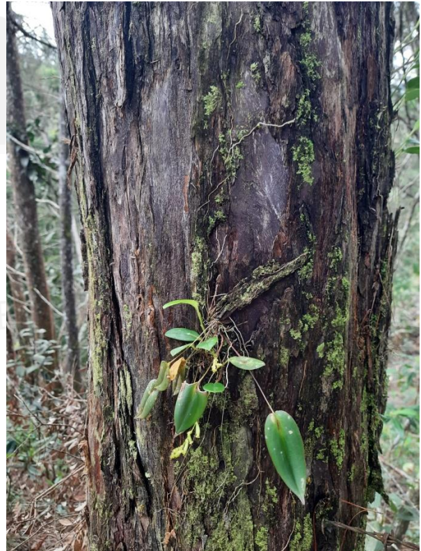
Imágenes 1 y 2: Árbol No. 16 con presencia de orquídeas.