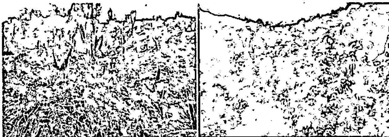
Bosque conservada en la ronda hidrica del acueducto comunal en el predio