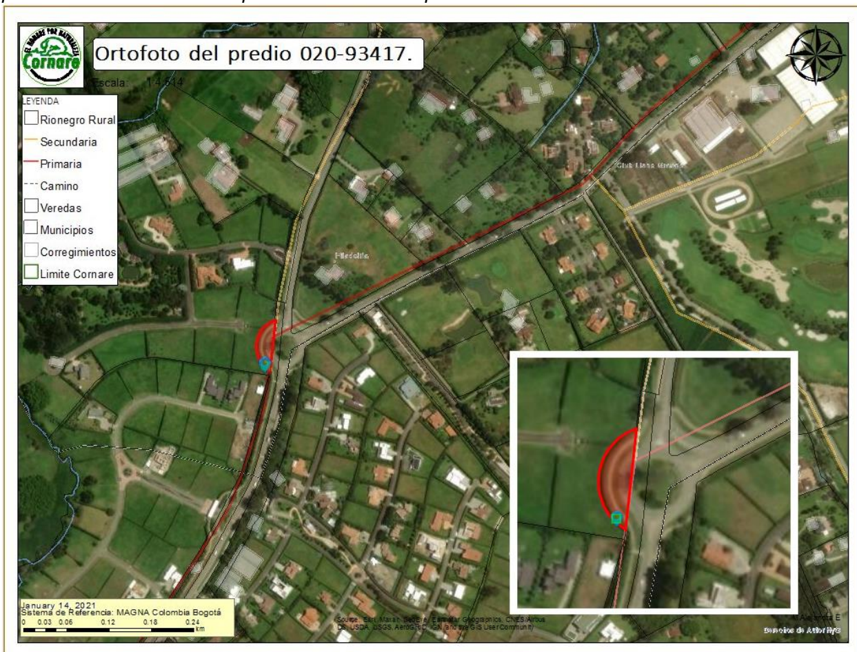
Imagen 1: Ortofoto con la ubicación del predio 020-93417 respecto a la rotonda vial.

El predio corresponde a una franja de terreno ubicada a un costado de una rotonda de la vía hacia la vereda Cabeceras de Llanogrande, se trata de la zona verde y de espacio público asociada a la rotonda, en la cual se tienen prados, algunos individuos arbustivos y un andén para los transeúntes. Dicho predio colinda con la parcelación Los Cerezos.