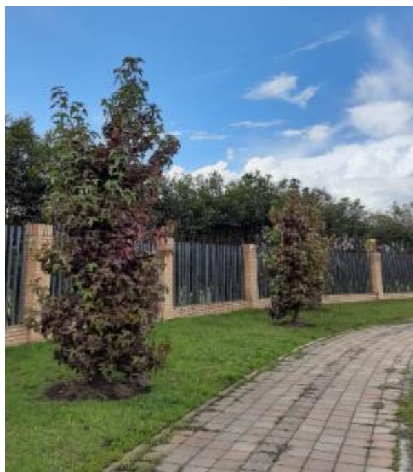
Imágenes 3 y 4: porte de los árboles y ubicación respecto al andén.