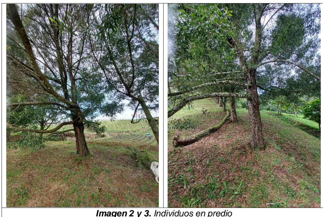
Imagen 2 y 3. Individuos en predio