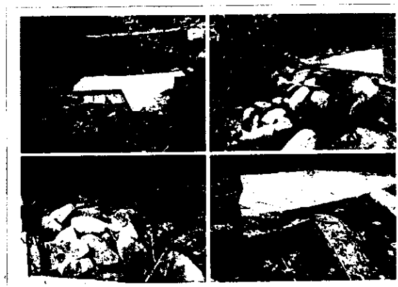
Imagen 1 Ocupación de Cauce (Placa en concreto sobre fuente sin nombre)