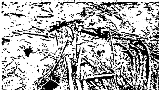
Residuos de caña de azúcar