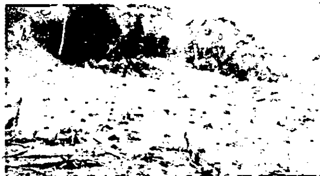
Área intervenida con la rocería y quema