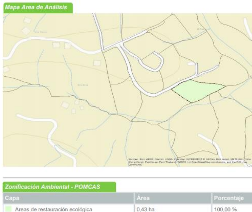
Imagen 2. Zonificación ambiental Predio de interés