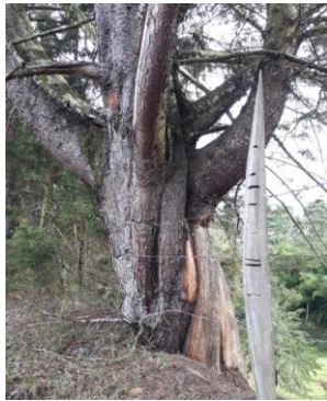
Imagen 4: Lindero.