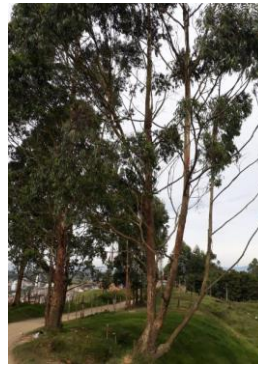
Imagen 5: Eucaliptos que se pretenden aprovechar.