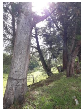
Imagen 3: Linderos donde se ubican los cipreses.