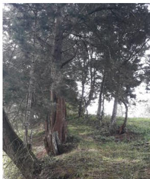
Imagen 2: Cipreses que se pretenden aprovechar