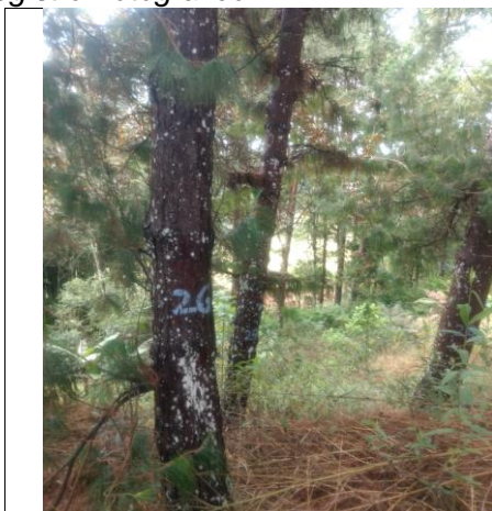
Imagen 2. Marcación árboles en predio