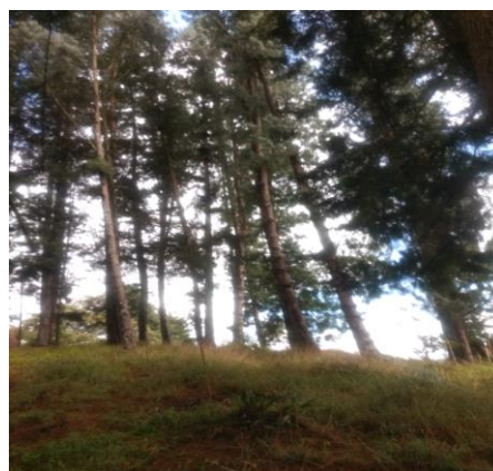
Imagen 3. Individuos al interior del predio