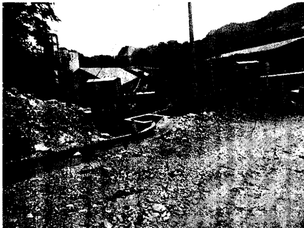
Lugar donde estaban los dos árboles que generaban riesgo

Para la protección de oficinas de la empresa OMYA, Conrare autoriza el apeo de dos (2) árboles, un (1) balso ( Ochroma pyramidale ) y un (1) carreto ( Aspidosperma Cuspa ), muy cercano a estas y con un volumen total de 1.06 m 3 . Los árboles se aprovecharon.