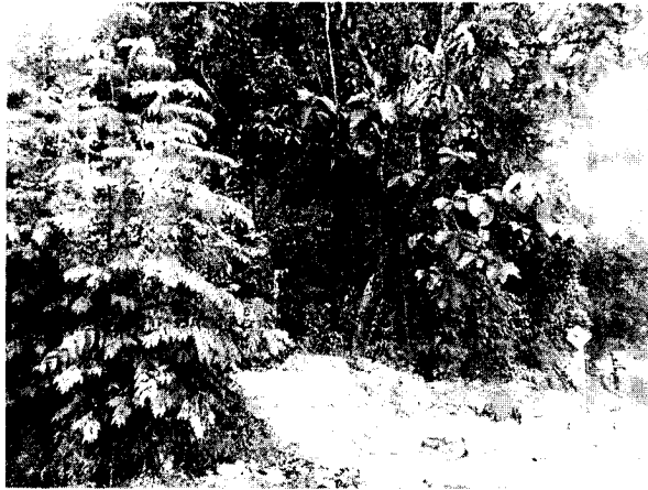
Donde se construyó carril de aceleración de Ecocemento

“ARTÍCULO SEGUNDO: INFORMAR al titular del permiso, que deberá realizar la compensación derivada del presente aprovechamiento de árboles aislados, con el fin de facilitar la no pérdida neta de biodiversidad y para ello cuentan con las siguientes alternativas: