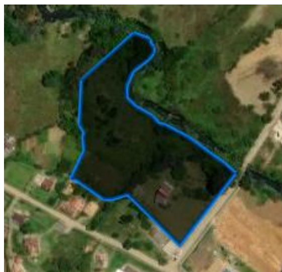
Imagen 3. Predios del interesado Fuente. Geoportal interno Elaboró. Jhon Jaramillo Tamayo

Nota 2: Como los predios son colindantes, el presente trámite se evaluará para los dos predios.