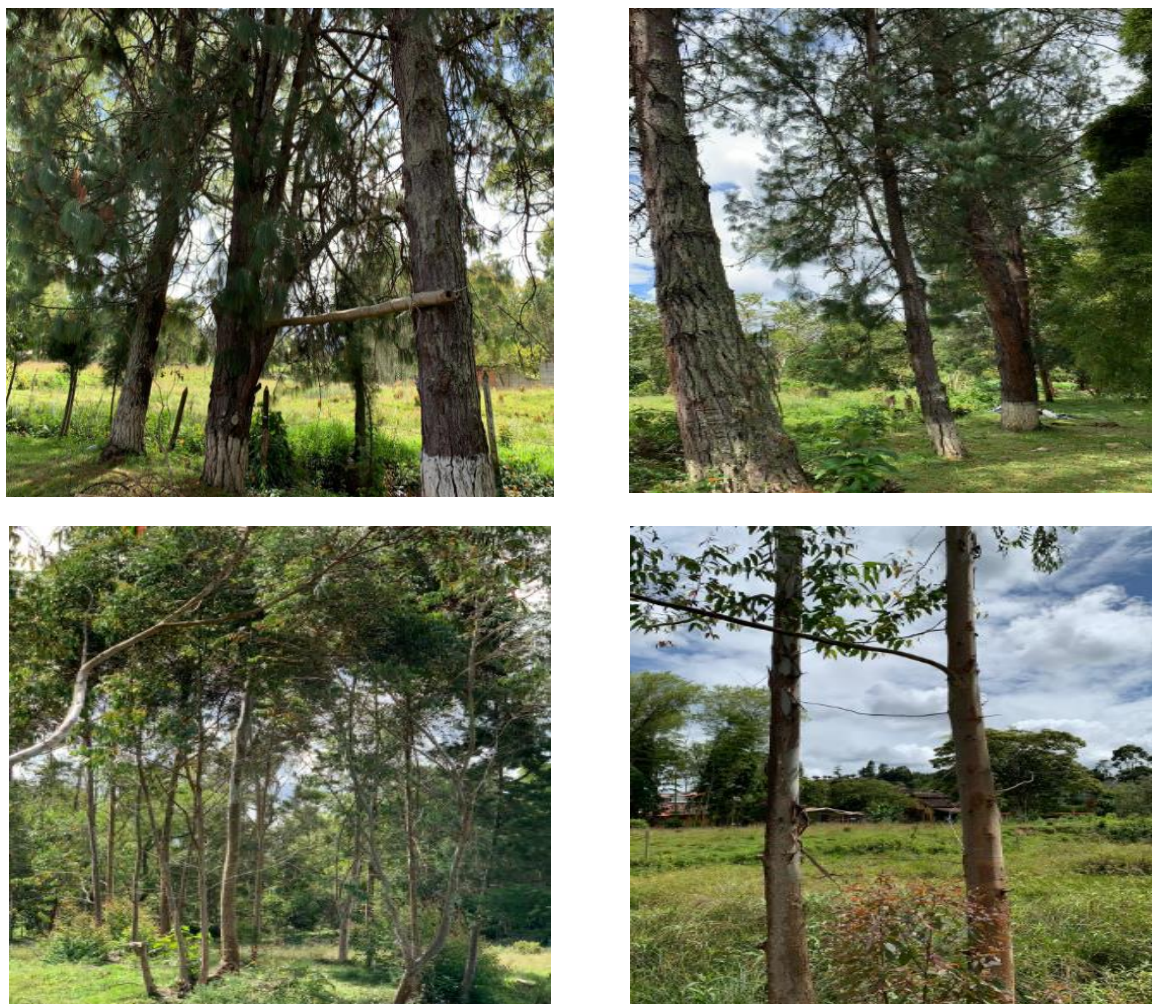
Imagen 4. Individuos a aprovechar.