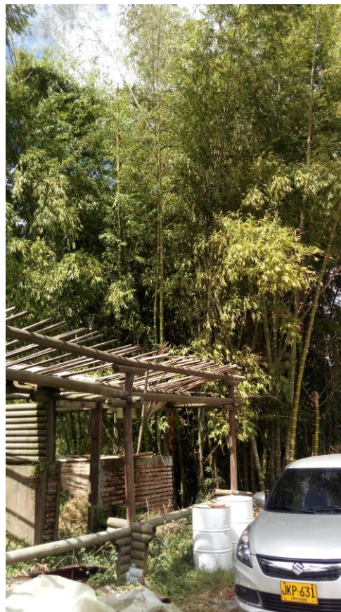
Imagen 1. Rodal de Guadua ( Guadua angustifolia ), Objeto de aprovechamiento