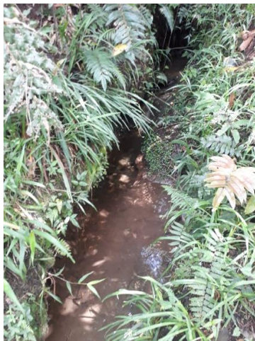
Imagen 3: Fuente sin nombre.