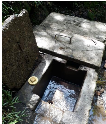
Imagen 4: Obra de captación