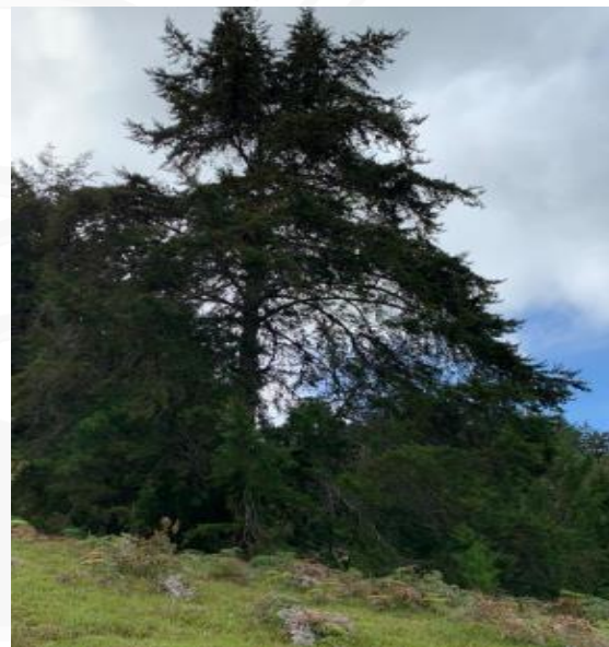
Imagen 2. Individuos a aprovechar. Fuente. Jhon Alexander Jaramillo Tamayo.