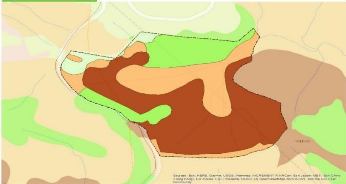
Mapa 1. Determinantes ambientales del predio Fuente. Geoportal Cornare Elaborado. Jhon Alexander Jaramillo Tamayo