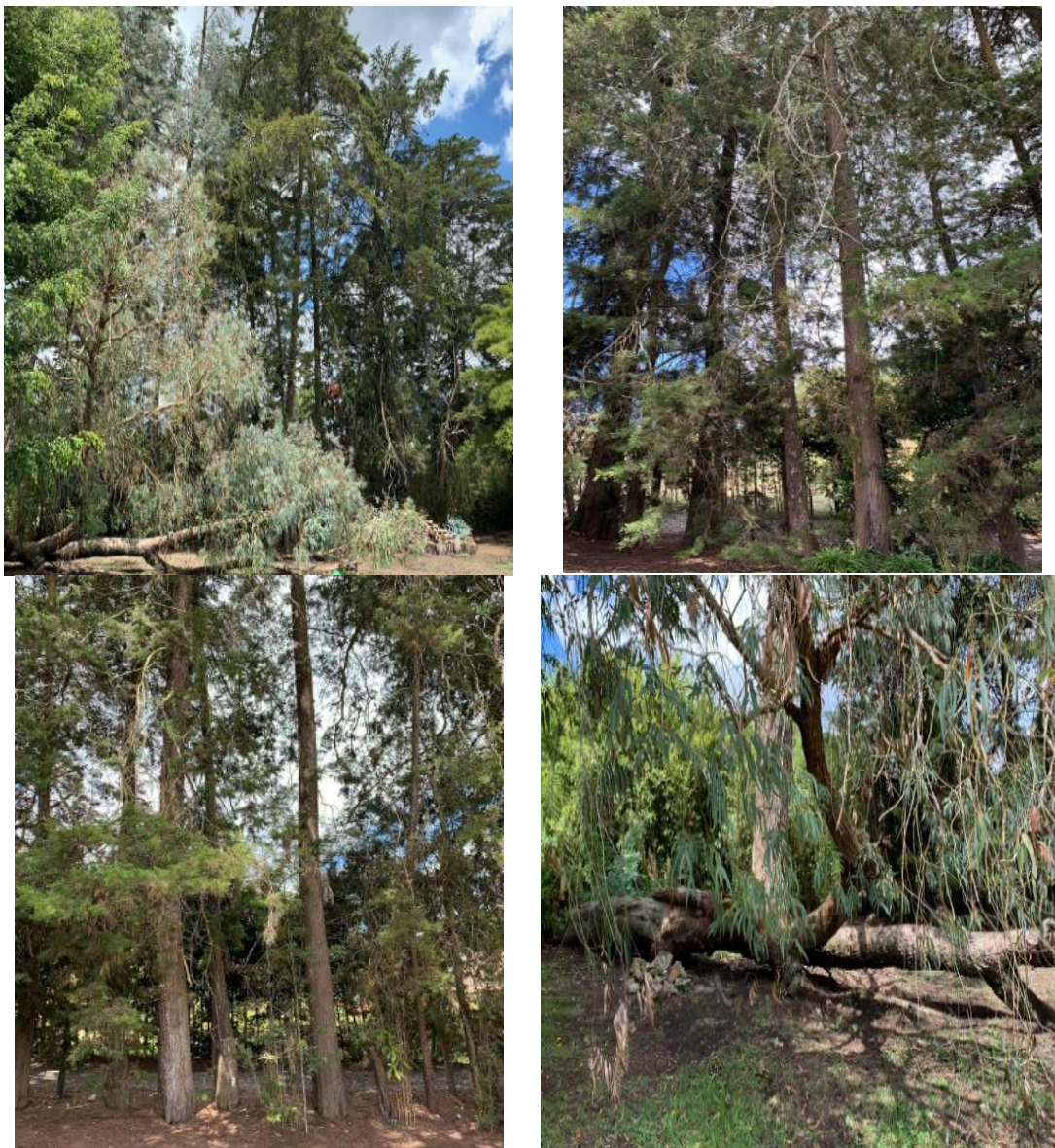
Imagen 2. Individuos a aprovechar.