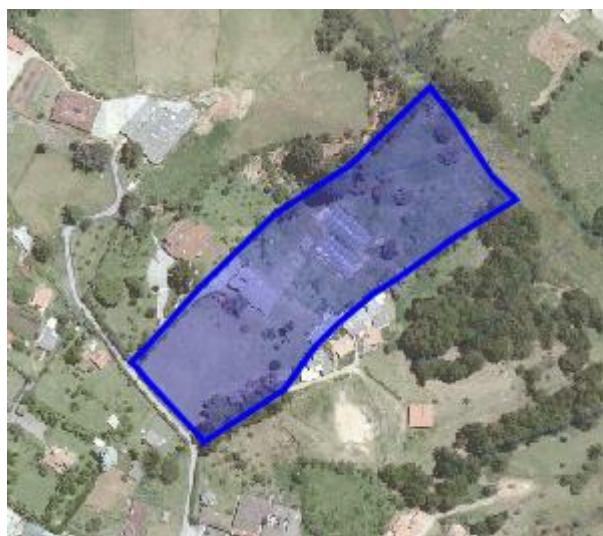
Imagen 1. Predio donde se realizará el aprovechamiento forestal de árboles aislados.