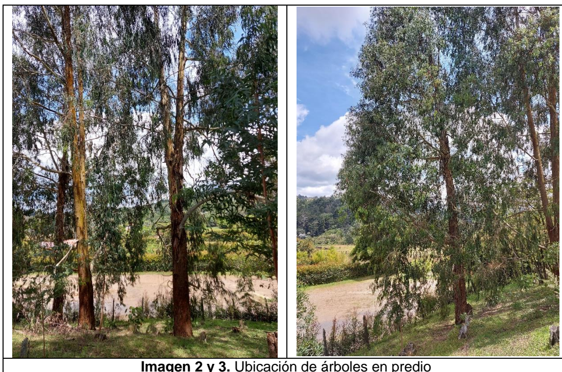
Imagen 2 y 3. Ubicación de árboles en predio