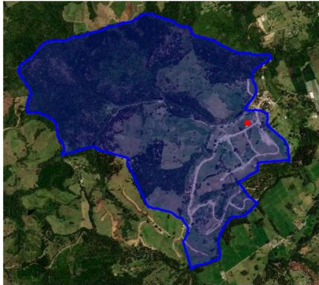
Imagen 1. ● Lote donde se realizará el aprovechamiento forestal de árboles aislados. Elaboró. Jhon Alexander Jaramillo Tamayo