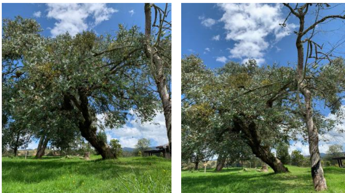
Imagen 2. Individuos a aprovechar.