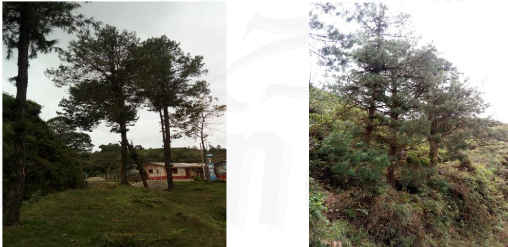
Figura 1. Registro fotográfico árboles a intervenir