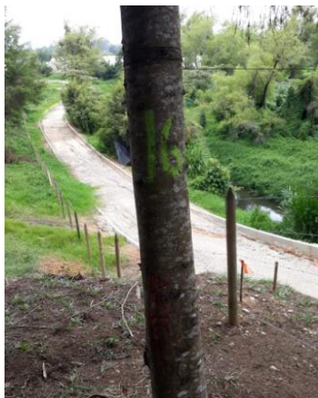
Imagen 2: Cicloruta en desarrollo.