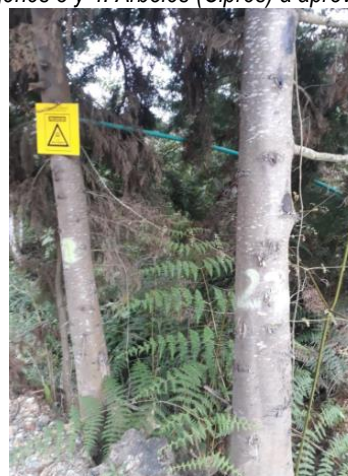
Imagen 6: Fuste y marcación de los árboles.