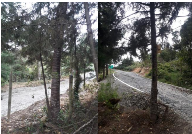
Imágenes 3 y 4: Árboles (Ciprés) a aprovechar.