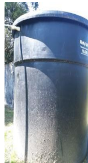
Imágenes 4 y 5: Captación en el Afluente Izquierdo. Tanque de almacenamiento

3.5 La concesión de aguas se solicitó mediante el Formulario Único Nacional para uso doméstico y riego, se relacionaron 6 personas permanentes y 6 transitorias, así como el