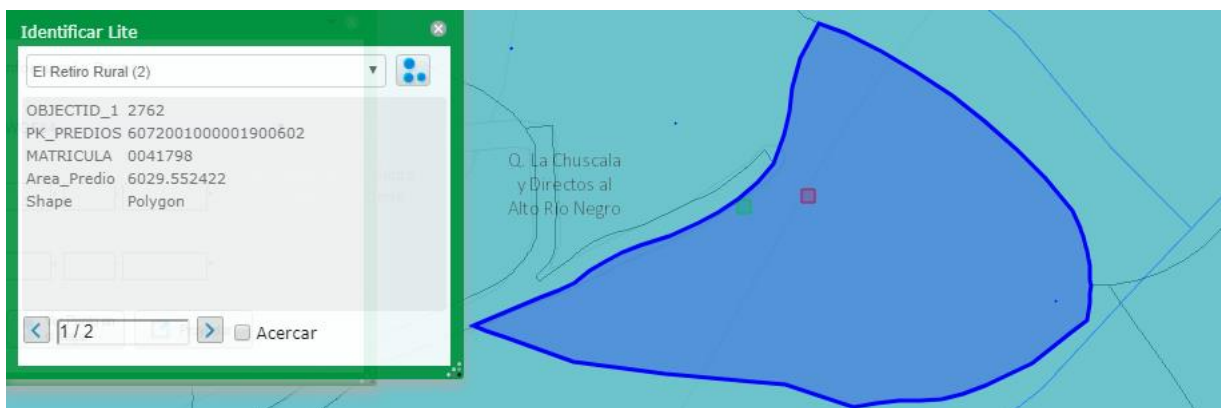
Imagen 1. Predio de interés

3.4 De acuerdo con el Sistema de Información Geográfica de Cornare, el predio de interés se encuentra en el área de influencia del Plan de Ordenación y Manejo de la Cuenca Hidrográfica del Río Negro (POMCA Río Negro), mediante la Resolución con radicado N°112-4795 del 8 de noviembre del 2018, se establece el régimen de usos al interior de la zonificación ambiental del POMCA del Río Negro.