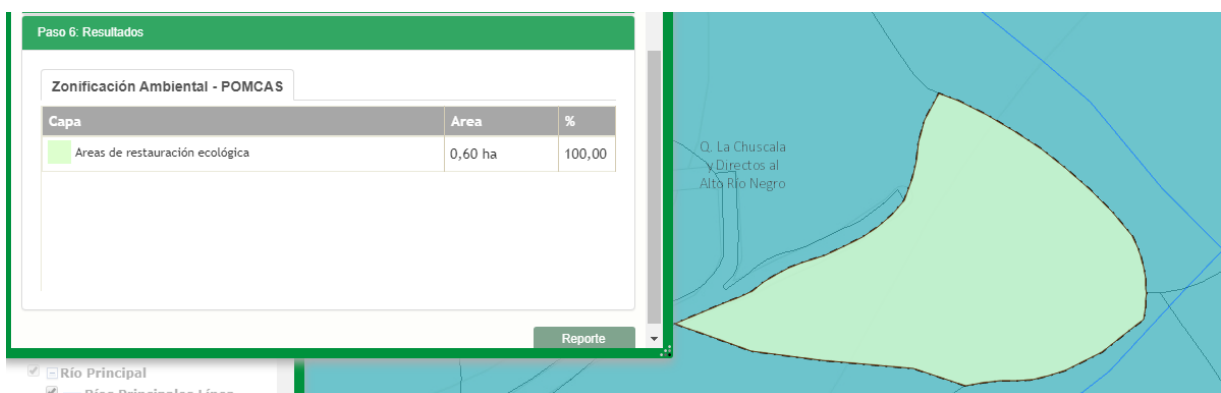
Imagen 2. Zonificación ambiental Predio de interés

Para el predio con FMI N° 017-41798 se tiene las siguientes restricciones: El 100% (0.60 Ha) se encuentra área de Restauración ecológica. (Ver Imagen 2.)