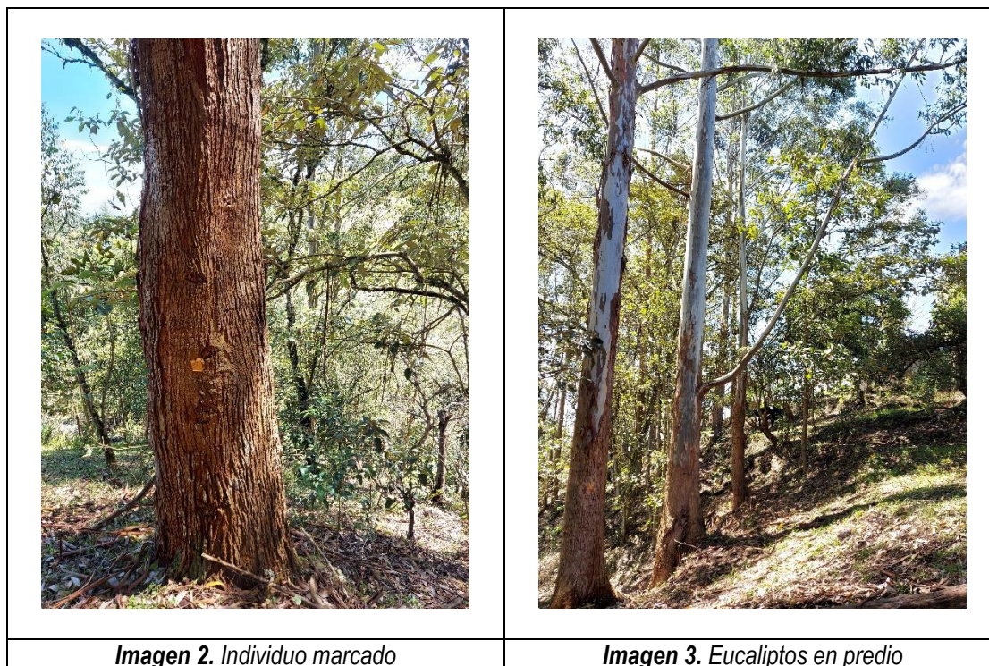
Imagen 2. Individuo marcado