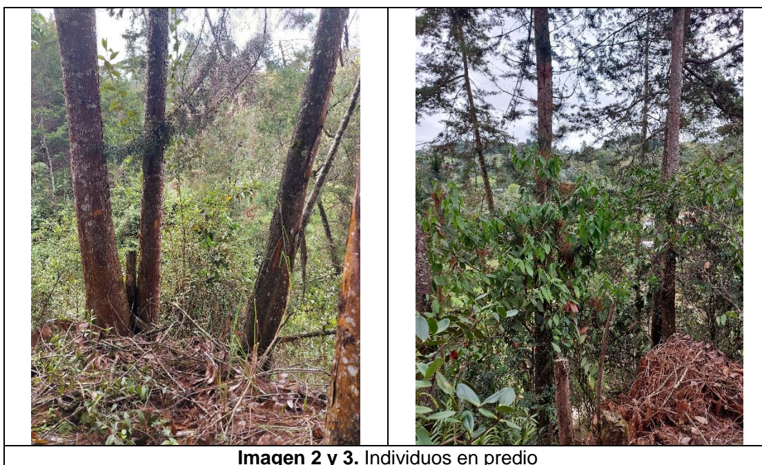
Imagen 2 y 3. Individuos en predio