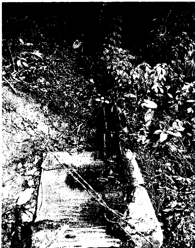
Sitio de captación artesanal a tanque desarenador

a) Obras para el aprovechamiento del agua: Capta directamente por guadua a tanque desarenador