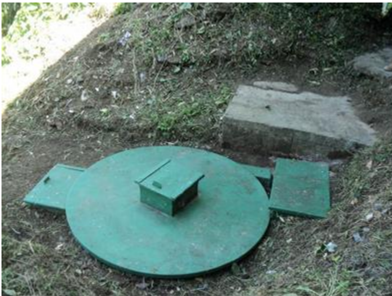
Imagen 2: Sistema de tratamiento de aguas residuales domésticas y pozo de absorción del establecimientos de comercial propiedad del señor Edgar Echeverri Giraldo