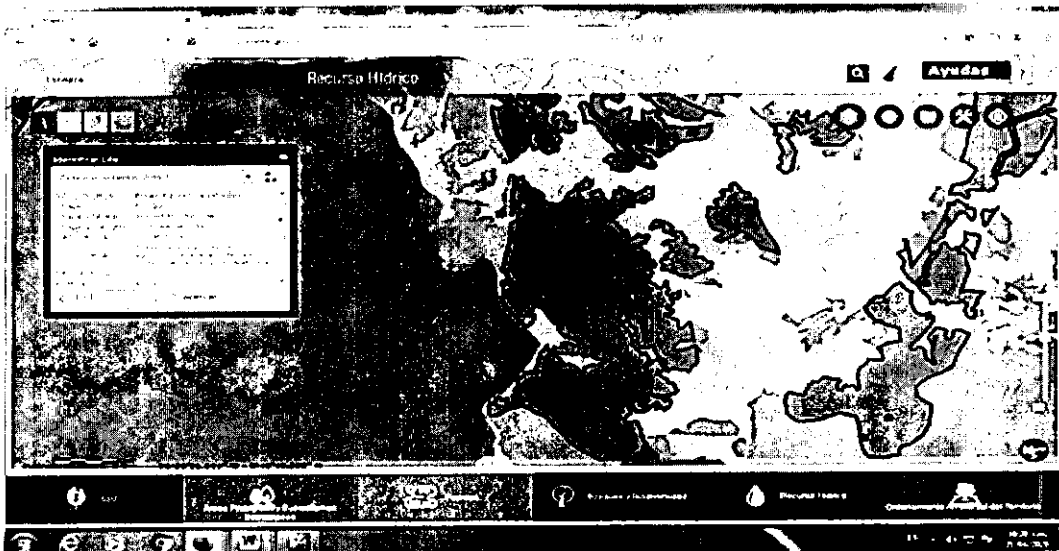
Imagen 2, Fuente MapGIS5 Comare.

El predio se encuentra ubicado en zona del POMCA del río Arma Resolución 112-0397 del 13 de febrero de 2019, zonas de área múltiple (Imagen 2);