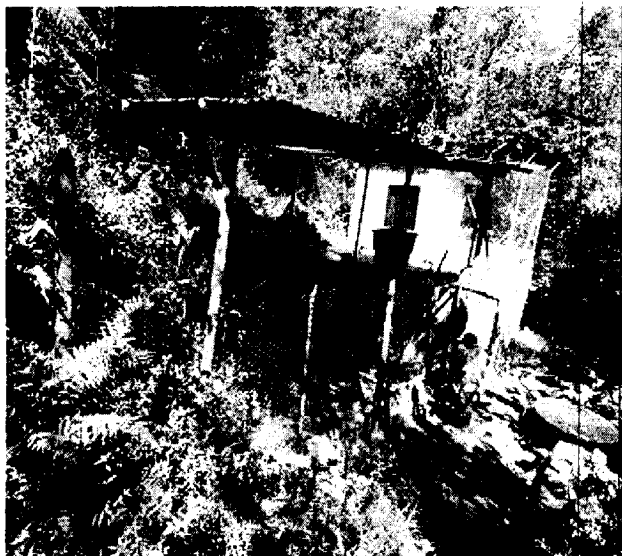
Imagen 4. Dispositivo de control de flujo