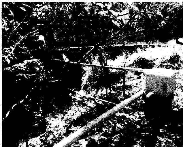
Imagen 1. Obra de captación