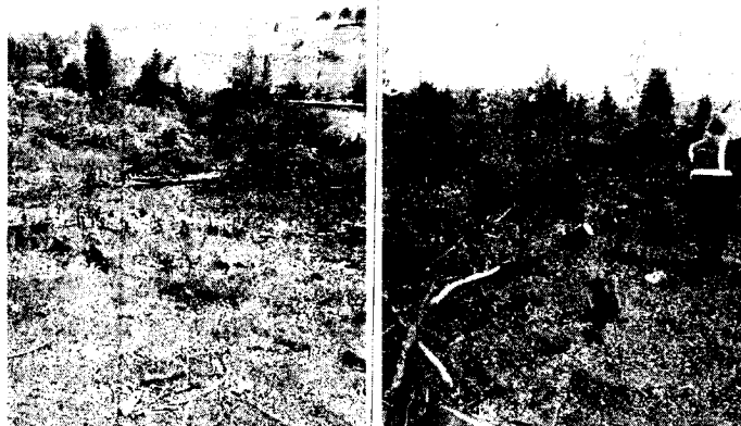
Foto 3 y 4: Restauración ecológica. Enriquecimiento con especies nativas

Otras situaciones encontradas en la visita: N.A.